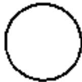
Waju - Círculo Azul

Outro elemento que se formou a partir do Akasha é o ar. Os iniciados encaram esse princípio não como um elemento real, mas colocam-no numa posição intermediária entre o princípio do fogo e o da água; o princípio do ar, como meio, por assim dizer, produz um equilíbrio neutro entre os efeitos passivo a ativo do fogo a da água. Através dos efeitos alternados dos elementos passivo a ativo do fogo a da água, toda a vida criada tomou-se movimento.