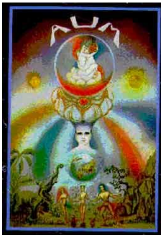
A Primeira carta do Tarô. Explicação do seu simbolismo.

Os reinos mineral, vegetal a animal, estão simbolicamente expressos na parte inferior da carta.