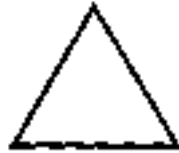
Tejas - Triângulo Vermelho

Como tivemos oportunidade de mencionar, o Akasha, ou Princípio Etérico, é a origem da criação dos elementos. O primeiro elemento que de acordo com os escritos orientais nasceu do Akasha, é Tejas, o princípio do fogo. Esse elemento, como todos os outros, não age só em nosso plano denso, material, mas em tudo o que foi criado. As características básicas do princípio do fogo são o calor e a expansão; é por isso que no começo da criação tudo era fogo a luz. A bíblia também diz: "Fiat lux - que se faça a luz". Naturalmente a base da luz é o fogo. Cada elemento, inclusive o fogo, possui duas polaridades, a ativa e a passiva, Le., Plus a Minus (mais a menos). A Plus é a construtiva, criadora, geradora, enquanto que a Minus é a desagregadora, exterminadora.